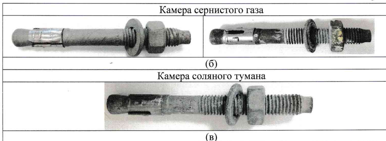
Рис. 2. Внешний вид анкеров ФИКСАР АНК после испытаний в камерах влажности (а), сернистого газа (б) и соляного тумана (в).

С целью оценки состояния материала исследуемых деталей вблизи поверхностей, а также определения качества покрытия, глубины и характера коррозионных повреждений проводили металлографический анализ с применением бинокулярного микроскопа Альтами-МЕТ.