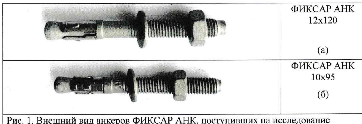
Рис. 1. Внешний вид анкеров ФИКСАР АНК, поступивших на исследование

Покрытие Magni 1000h на анкерах ФИКСАР АНК в состоянии поставки (рис.1а, б) светло-серого цвета, равномерное, гладкое, без наплывов и признаков нарушения сплошности покрытия, что соответствует требованиям ГОСТ 9.307-89 «ЕСЗКС. Покрытия цинковые горячие. Общие требования и методы контроля».