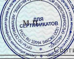
Схема сертификации ЗС

Сроки хранения (годности) указаны в прилагаемой к продукции товаросопроводительной документации и/или на упаковке каждой единицы продукции.